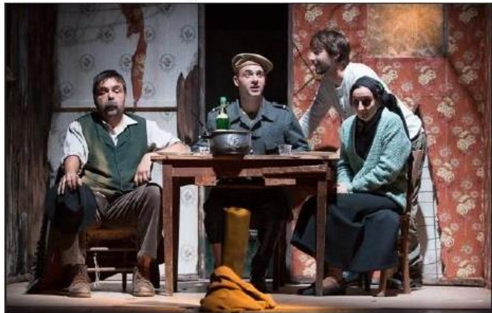
Une famille retrouve sa maison détruite après la guerre.

À voir du mardi au samedi à 19 h 30, le dimanche à 17 h. Jusqu'au 13 novembre. Réservations sur http://chapiteau-theatre.com ou à l'office de tourisme.