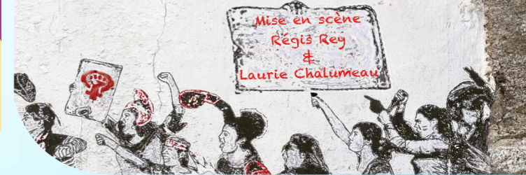
Illustration : Nathalie Leger