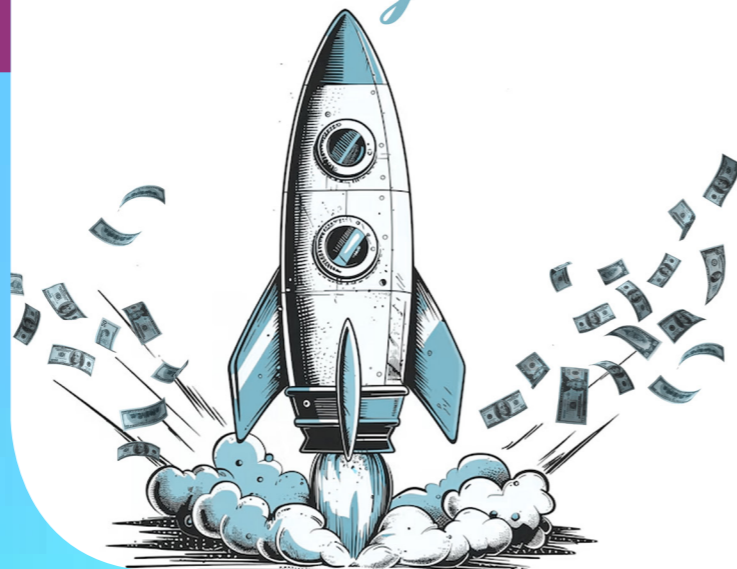
Illustration : Violaine Stevenin