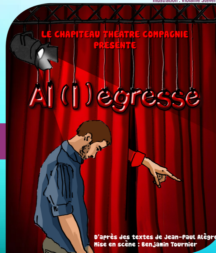
Illustration : Violaine Stevenin

L'enjeu est de taille, nous sommes là pour faire du théâtre !